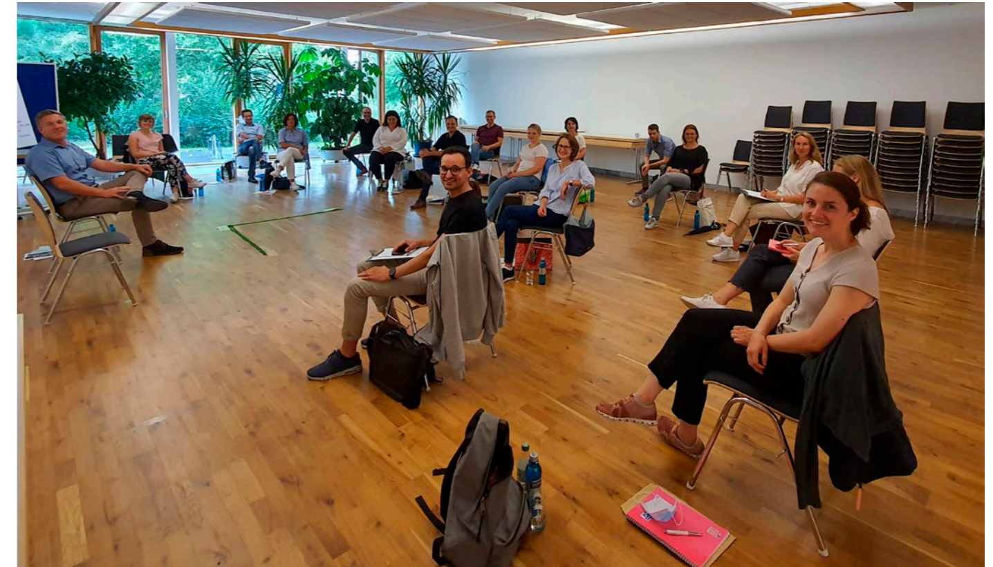
Freude bei der ausgebuchten Coachausbildung: Endlich dürfen wir uns „in echt“ treffen!

Das zweite Modul konnte dann in Präsenz stattfinden. Wir waren sehr neugierig aufeinander und sehr erstaunt, wie schnell wir als Gruppe trotz – oder möglicherweise auch wegen – des digitalen Einstiegs miteinander vertraut und zur Lerngemeinschaft zusammengewachsen waren. Unser Thema war Aufstellungs- und Systemarbeit, was auf den ersten Blick im persönlichen Kontakt mit dem Coachee besser anzuwenden scheint. Und natürlich fühlt es sich unmittelbarer an, wenn man nebeneinander im Raum steht und physisch Schritte auf eine Lösung zugeht und sich physisch von einem Problem abwendet. Aber auch da lernten wir gleich, wie man diese Techniken virtuell anwenden und dieselben Effekte erzielen und gute Ergebnisse erreichen kann.